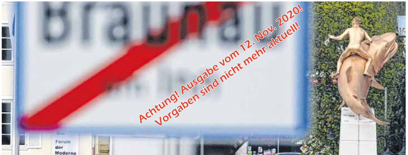
Der Corona-Lockdown in Österreich und Deutschland und die Reisewarnung bringen viele Fragen mit sich.